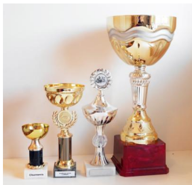
Instiftad av 08 KaninhopparTeam